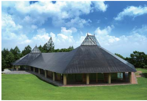
八ヶ岳高原音楽堂 1988~