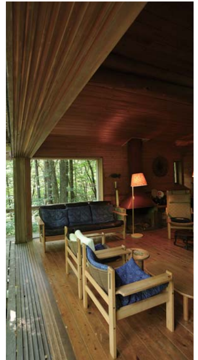
「小さな森の家」吉村山荘 1962~