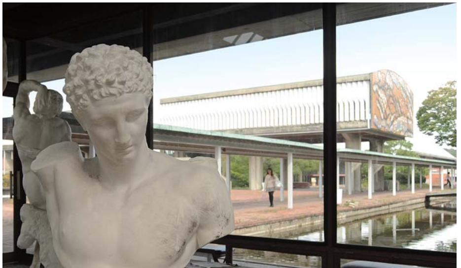
愛知県立芸術大学 1966~